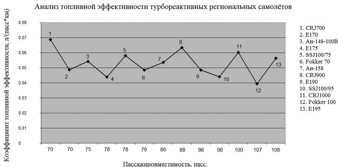
Рис. 2. Анализ топливной эффективности турбореактивных региональных самолетов

молётом, оснащённым турбореактивными двигателями, – самолёт Fokker 100 с показателем 0,0394027 л/(пасс-км), хотя этот самолёт можно назвать региональным с натяжкой, так как его вместимость составляет 107 пассажиров, а дальность полёта 3170 км позволяет выполнять полёты на рейсах средней протяжённости. Самым экономичным региональным пассажирским самолётом вместимостью до 100 пассажиров является Embraer E175 с показателем коэффициента топливной эффективности 0.0437759 л/(пасс-км), весьма близок к нему самолёт Сухой Суперджет SSJ 100/95 с показателем 0.0439733 л/(пасс-км).