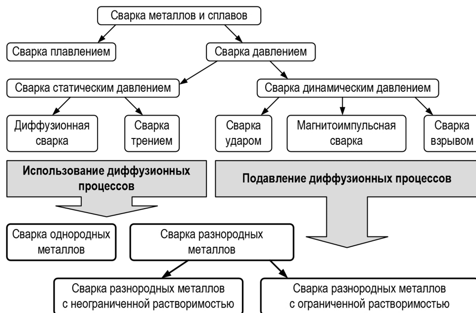
Рис. 1. Схема классификации сварочных процессов по применимости для получения неразъемных соединений металлов с ограниченной взаимной растворимостью по признаку применения диффузионных процессов

разъемных соединений металлов с ограниченной взаимной растворимостью представлена в виде схемы (рис. 1).