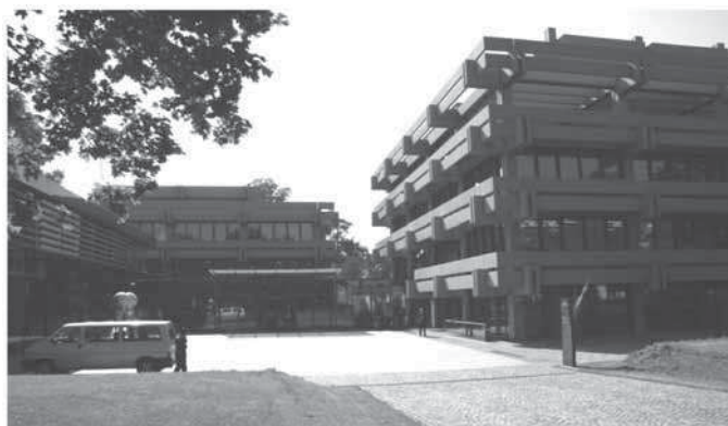
Торгово-промышленная палата Аугсбурга, ФРГ, где в сентябре 2008 года проходила конференция SETEC-2008 общества SAMPE-Европа

Третья конференция SETEC, прошла в сентябре 2008 года в Аугсбурге — центре авиационно-космической промышленности ФРГ. Участники конференции, помимо работы на ее сессиях, получили возможность ознакомиться с производственными и конструкторскими подразделениями таких предприятий как: EADS Aerospace Augsburg (этот завод отделения по обороне и безопасности группы EADS специализируется на поставке авиационных компонентов, в том числе из композитов. 70% заказов приходится на компанию Airbus); SGL Carbon Group, Meitingen (этот завод одной из крупнейших в мире компаний по разработке и производству продукции