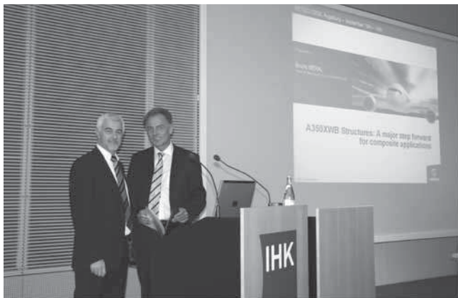
Во время конференции SETEC-2008 общества SAMPE-Европа, сентябрь 2008 года, Аугсбург, ФРГ

из углерода и графита специализируется на углеволоконных композитах и является единственным в Европе по производству углеволоконных композитов); MT Aerospace Augsburg (разрабатывает и производит элементы и подсистемы для авиационно-космической промышленности с использованием металлов и волоконных композитов); EUROCOPTER Donauwörth (центр германской вертолетной отрасли, производящий также двери для самолетов Airbus); KUKA Robotic, Augsburg (разработка и производство робототехники).