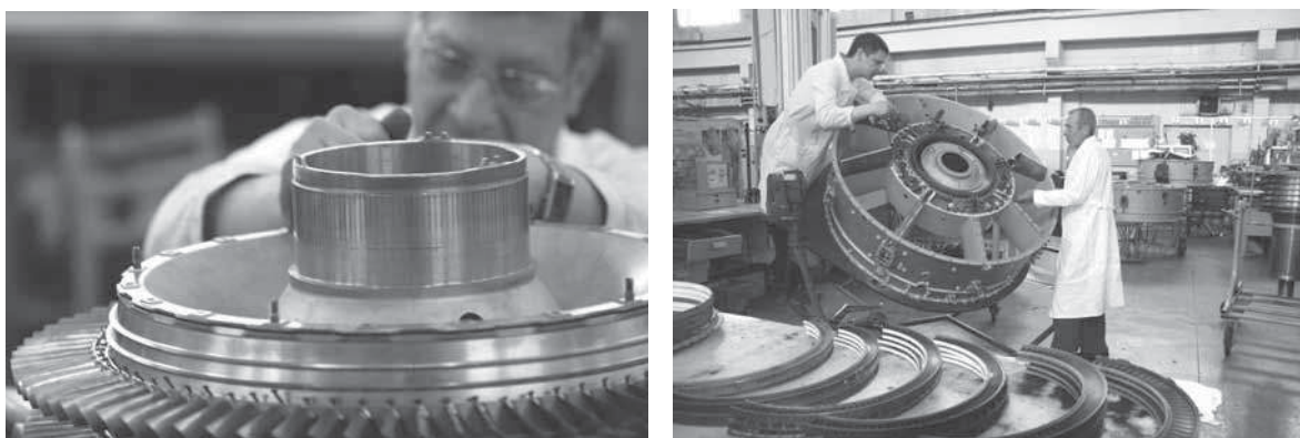
Рис. 2. Ремонт и сборка двигателей