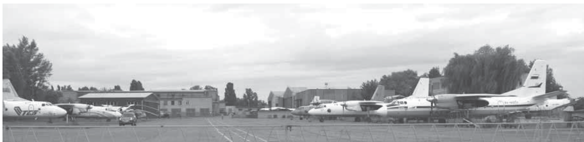
Рис. 3. Современная территория завода

Сегодня ГП "ЗАВОД 410 ГА" — это единственное предприятие в Украине, которое предлагает широкий выбор услуг, связанных с ремонтом и сервисным обслуживанием авиационной техники самолетов Ан-24, -26, -30, -32, -74, двигателей Д-36 для отечественных и иностранных заказчиков (рис. 4). На базе недавно созданного летно-