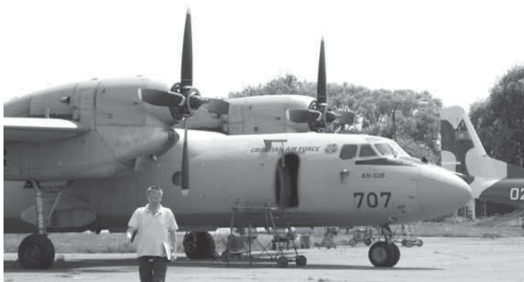
Рис. 1. Самолет Ан-32. Заказчик – Хорватия

Более чем полувековую деятельность завода можно условно разделить на несколько этапов: ремонт поршневых авиационных двигателей АШ-62ИР, АШ-82Т; ремонт самолетов Ил-12, Ил-14; создания самолетно-ремонтного производства – в 1964 году был выпущен первый отреставрированный самолет Ан-24, ставший на долгие годы основной продукцией завода; освоение ремонта Ан-26, Ан-30, Ан-32 (рис. 1–2); техническое обслуживание самолета Ан-74; освоение ремонтного производства авиадвигателей – капитальный ремонт двигателя Д-36 для самолетов Як-42, Ан-72, Ан-74; ремонт турбовинтовых (Аи-25) и газотурбинной реак-